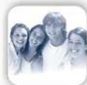
Plan Joven (permanencia hasta los 40 años de edad inclusive)