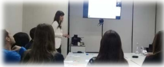
Gestión de la Estrategia Profesional y Organizacional

Colegio de Graduados en Ciencias Económicas de Rosario