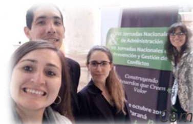
Jornadas Provinciales de Administración