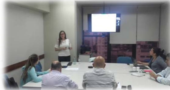
Planificación Estratégica Ágil