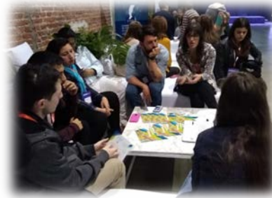
Clínica de Plan de Negocios