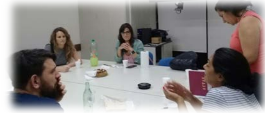
Herramientas ágiles para organizar y planificar un proyecto cultural