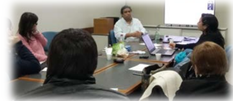
Inteligencia de Negocio